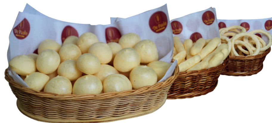
Biscoito de Polvilho 2 kg