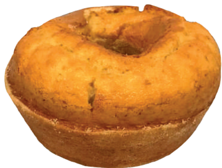
Massa de bolo Sabor Laranja 2,7kg