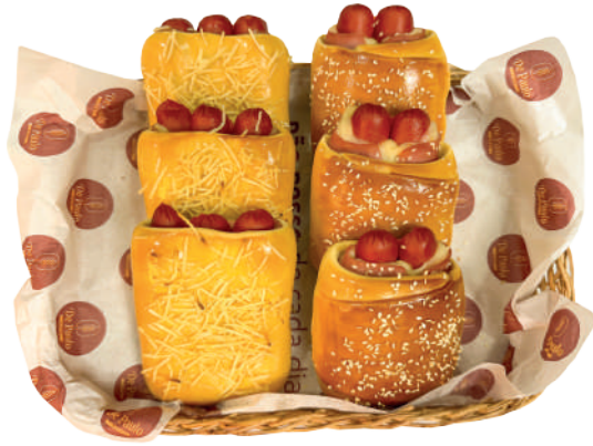
Hot Dog de forno