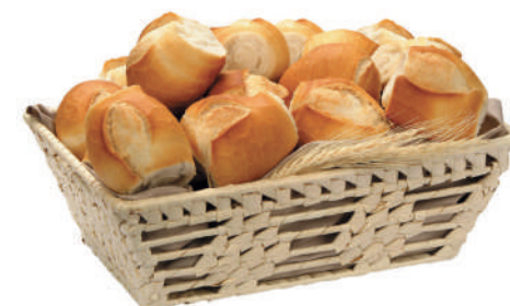
Pão Francês Mini 35g / 7kg