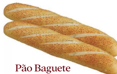
Pão Baguete 250g / 7kg