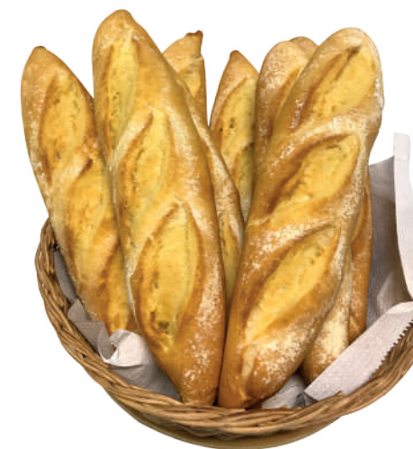
Pão Banette Rústica 100g / 7kg