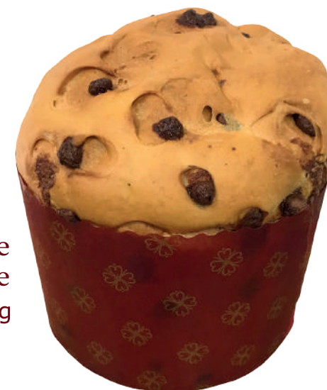
Panetone de Chocolate 90g / 450g