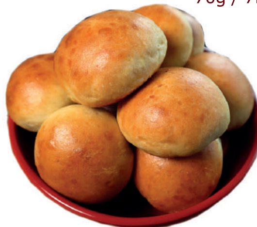
Pão de Batata 40g / 7kg 70g / 7kg