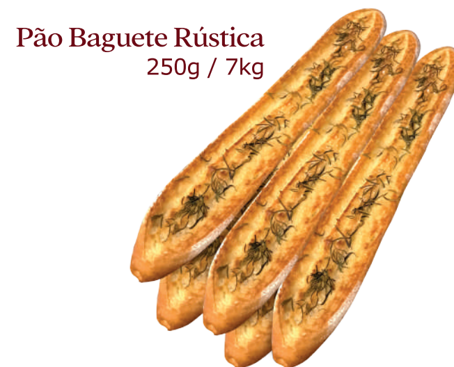
Pão Baguete Rústica 250g / 7kg