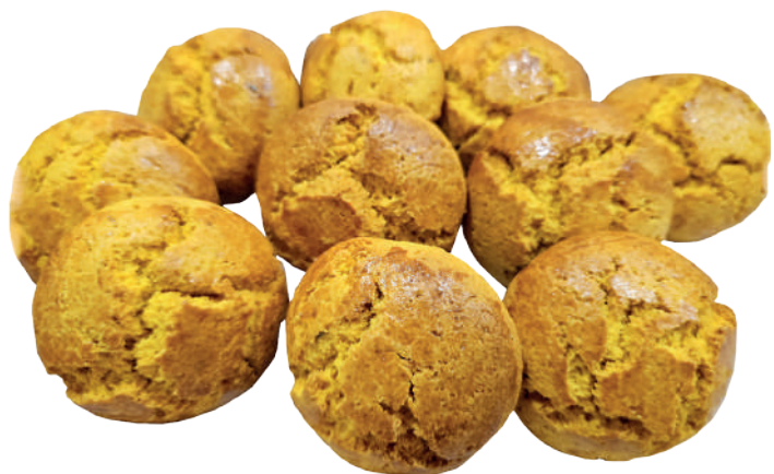
Broa de Milho 40g