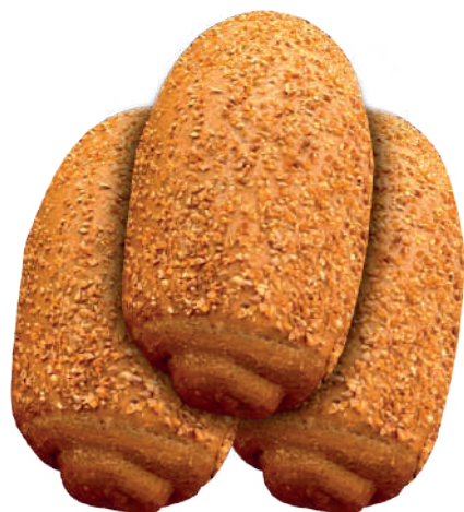
Pão Francês Integral 70g / 7kg