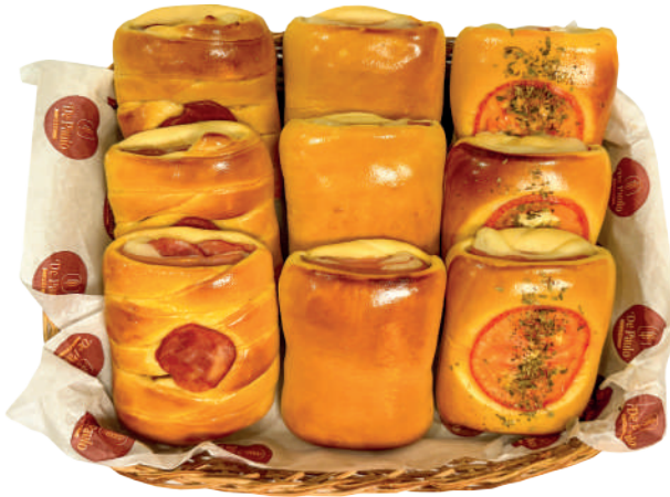
Enroladinho de Presunto