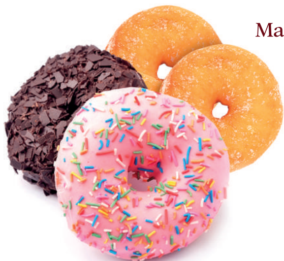
Massa para Donut