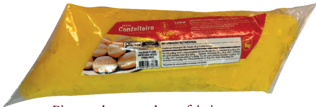
Bisnaga de creme de confeiteiro 1kg