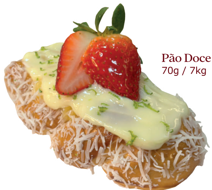
Pão Doce 70g / 7kg