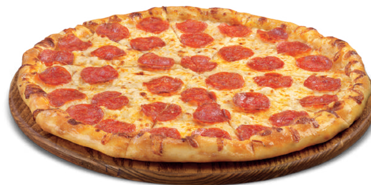
Massa para Pizza 225g / 7kg