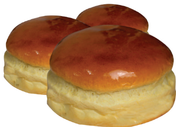
Pão de Hambúrguer Brioche