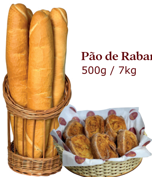
Pão de Rabanada 500g / 7kg