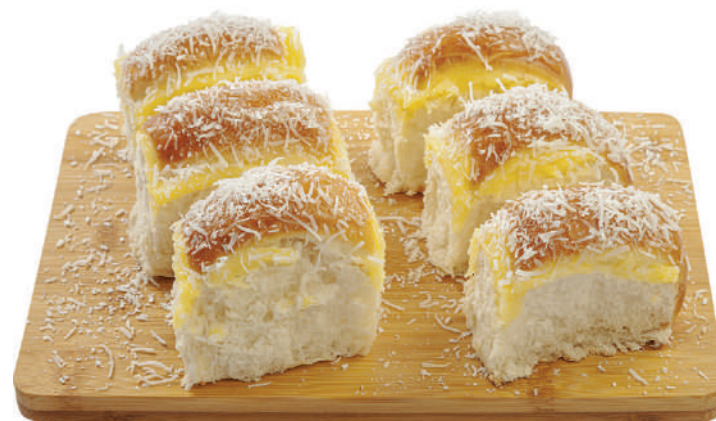
Pão Doce Mini 35g / 7kg