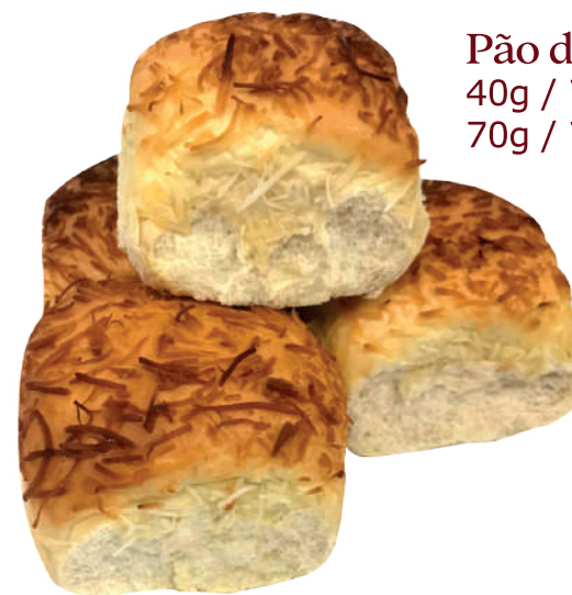
Pão de Coco 40g / 7kg 70g / 7kg