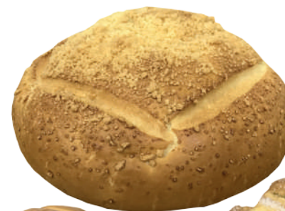
Pão Mix da Roça