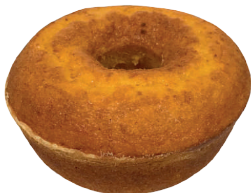
Massa de bolo Sabor Fubá 2,7kg