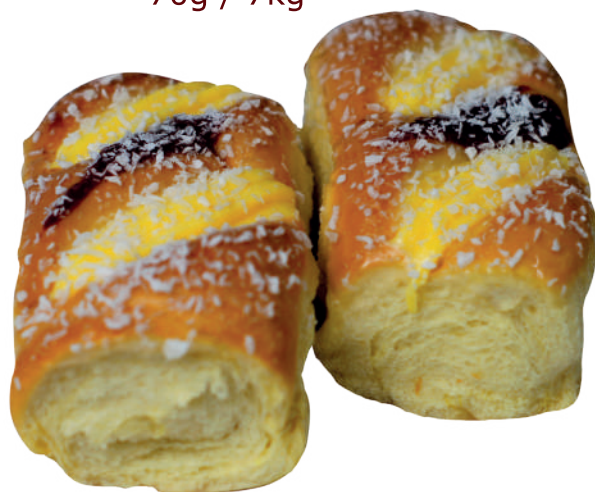
Pão doce Premium 70g / 7kg