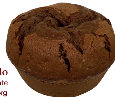
Massa de bolo Sabor Chocolate 2,7kg