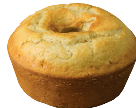
Massa de bolo Sabor neutro 2,7kg