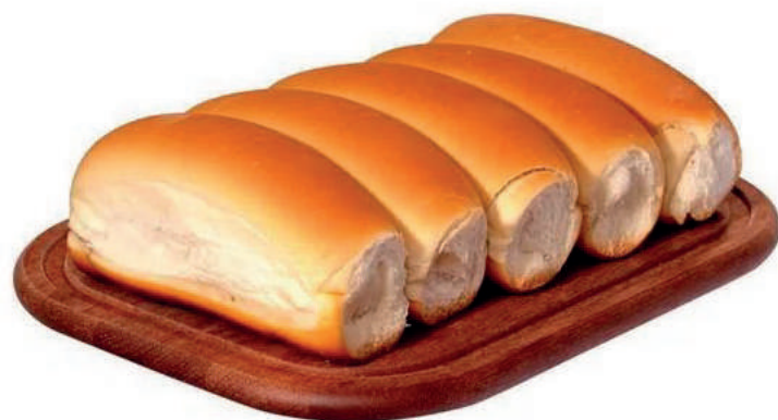
Pão de Hot Dog 70g / 7kg 90g / 7kg