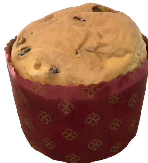
Panetone com frutas cristalizadas 90g / 450g