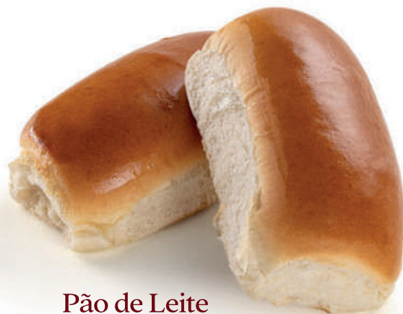
Pão de Leite 35g / 7kg 70g / 7kg