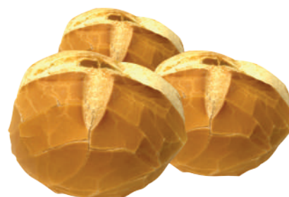
Pão Francês Redondo 70g / 7kg