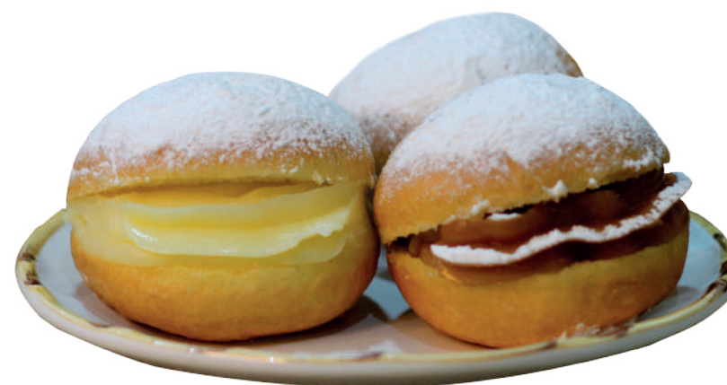
Massa para Sonho 40g / 7kg 70g / 7kg