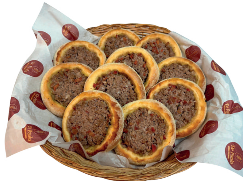
Massa para Esfiha aberta