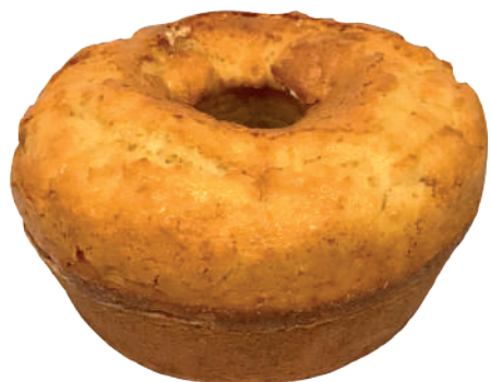
Massa de bolo Sabor Baunilha 2,7kg