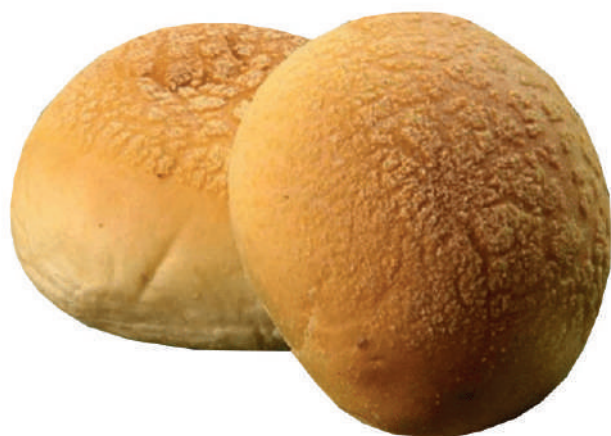
Pão de Milho com e sem erva-doce