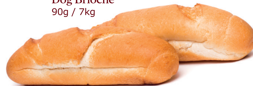
Pão de Hot Dog Brioche 90g / 7kg