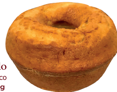
Massa de bolo Sabor Coco 2,7kg