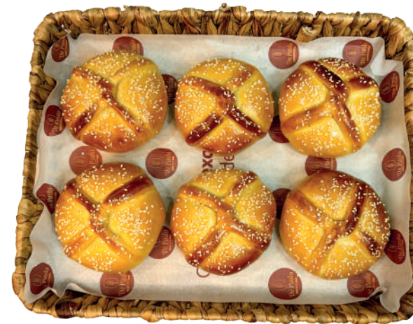
Hambúrguer de Forno