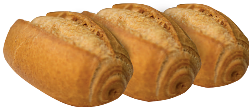
Pão Francês de Fibras Integral 70g / 7kg