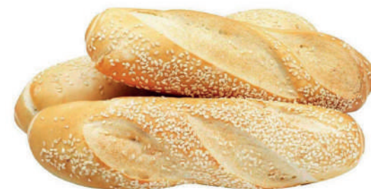
Pão Baguete Mini 62g / 7kg 100g / 7kg