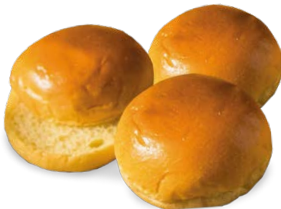
Pão de Hambúrguer Brioche 70g / 7kg 90g / 7kg Fermentação Alta (4h a 6h)