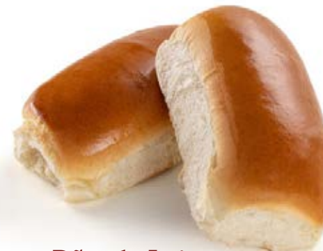
Pão de Leite 70g / 7kg Fermentação Alta (4h a 6h)