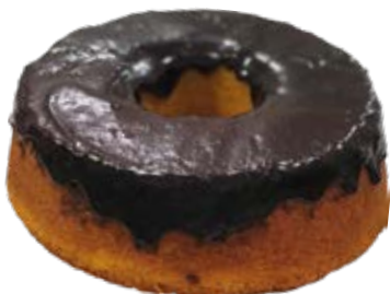
Cenoura com Chocolate 500g