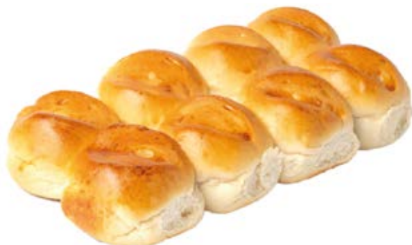
Pão de Leite Mini 35g / 7kg Fermentação Alta (4h a 6h)