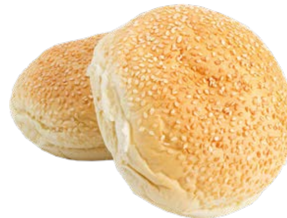
Pão de Hambúrguer 70g / 7kg 90g / 7kg Fermentação Alta (4h a 6h)