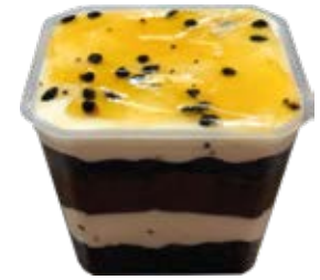
Bolo de Pote Maracujá c/ Chocolate 250ml und.