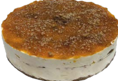
Torta Damasco Zero Açúcar und.