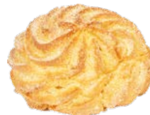
Mini Broa Aerosa 0,50kg / 20 unds.