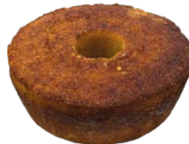
Milho 500g ou 1kg