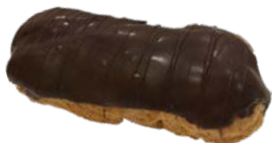
Bomba 0,30kg / 6 unds. Bandeja Recheios: Chocolate Doce de Leite Creme