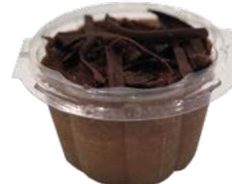
Mousse de Chocolate Copo 110ml und.