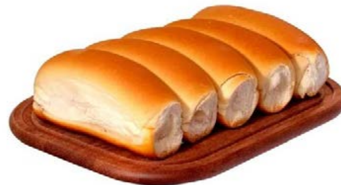
Pão de Hot Dog 70g / 7kg Fermentação Alta (4h a 6h)

*Algumas imagens poderão ser apenas ilustrativas. Todas as medidas descritas poderão sofrer alterações, seja na quantidade por peso, pacote ou outra embalagem.