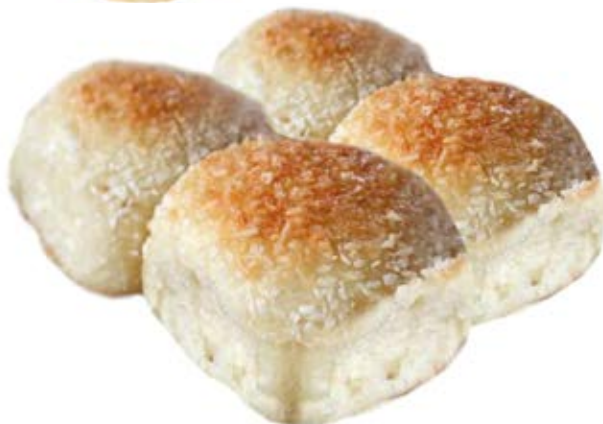
Pão de Coco 70g / 7kg Fermentação Alta (4h a 6h)