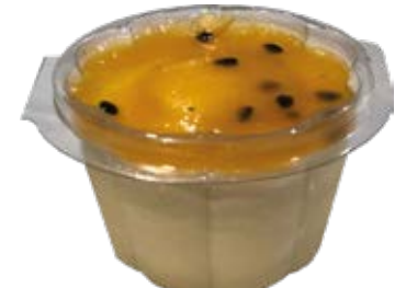
Mousse de Maracujá Copo 110ml und.