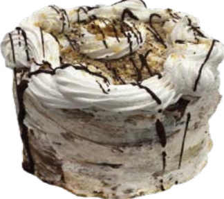
Mini Torta Nozes Zero Açúcar und.