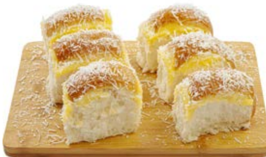
Pão Doce Mini 35g / 7kg Fermentação Alta (4h a 6h)