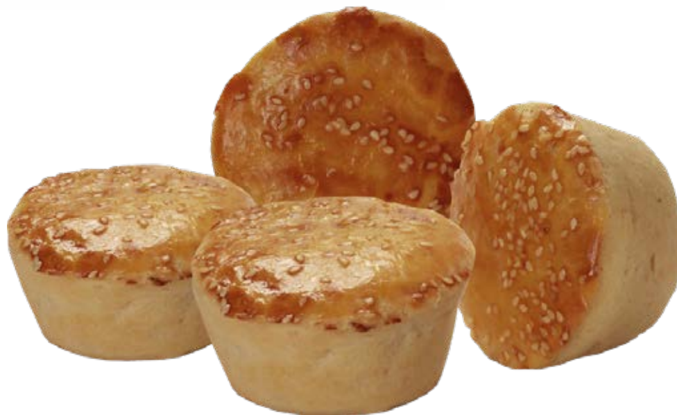
Empada 100g / 1,2kg / 12 unds.

Sabores: Palmito Calabresa Frango com Requeijão Legumes Camarão