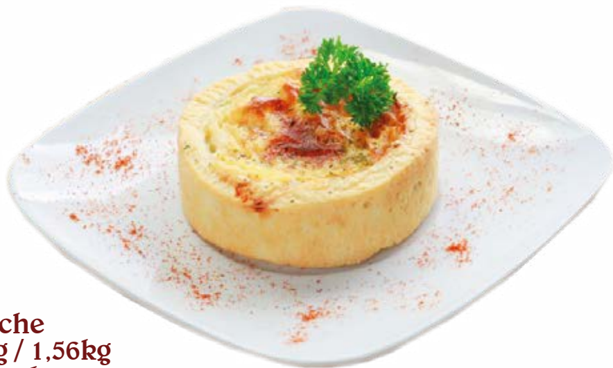
Quiche 130g / 1,56kg 12 unds.

Sabores: Alho Poró Mix de Queijos Strogonof de Frango