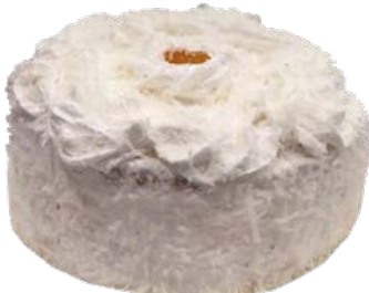
Mini Torta Abacaxi Zero Açúcar und.