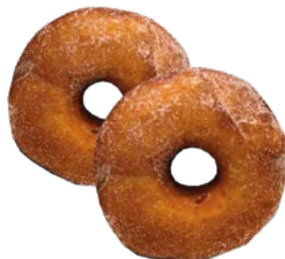
Donuts Americano sem Recheio sem cobertura 0,18kg / 6 unds.