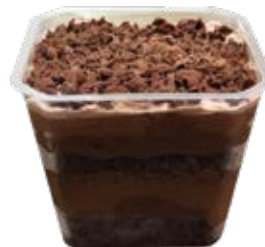
Bolo de Pote Brigadeiro 250ml und.