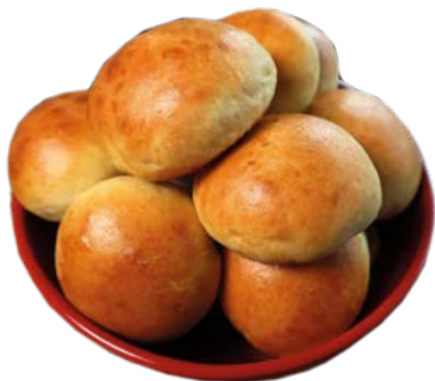
Pão de Batata 70g / 7kg Fermentação Alta (4h a 6h)