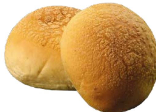
Pão de Milho 70g / 7kg Fermentação Alta (4h a 6h)