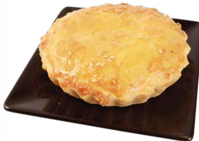
Torta 130g / 1,56kg 12 unds.

Sabores: Alho Poró Mix de Queijos Strogonof de Frango