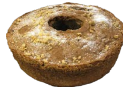
Nozes com Café 500g

*Algumas imagens poderão ser apenas ilustrativas. Todas as medidas descritas poderão sofrer alterações, seja na quantidade por peso, pacote ou outra embalagem.