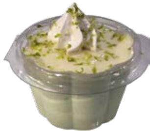
Mousse de Limão Copo 110ml und.