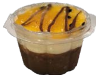
Mousse de Maracujá com Chocolate Copo 110ml und.