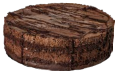
Mousse de Chocolate

Tamanhos: 20cm (12 pedaços) 25cm (16 pedaços)