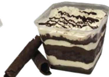
Bolo de Pote Ninho c/ Nutela 250ml und.