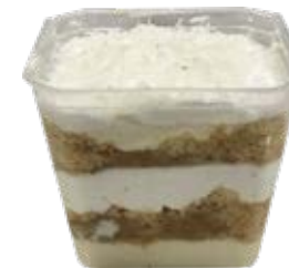
Bolo de Pote Beijinho 250ml und.