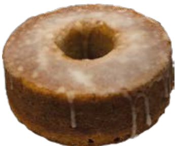
Laranja 500g ou 1kg