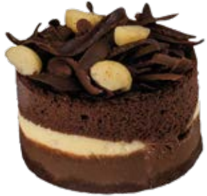
Tortelete Macadâmia Trufada und.