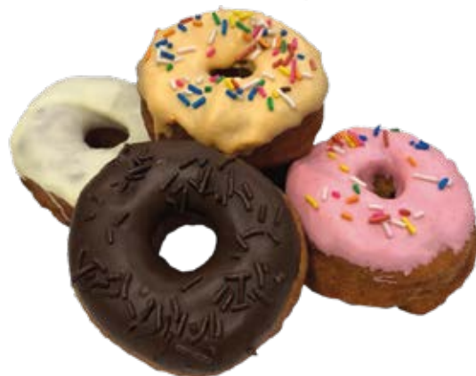
Donuts Americano com Recheio 0,30kg / 6 unds. Recheio Chocolate + Cobertura Chocolate Pt Recheio Chocolate + Cobertura Chocolate Br Recheio Doce de Leite + Cobertura Chocolate Pt Recheio Doce de Leite + Cobertura Chocolate Br Recheio Creme + Cobertura Chocolate Pt Recheio Creme + Cobertura Chocolate Br Recheio Frutas Vermelhas + Cobertura Chocolate Br Recheio Limão + Cobertura Chocolate Br