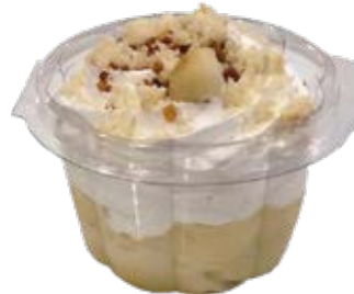
Pavê Moça de Macadâmia Copo 110ml und.