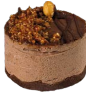
Tortelete Ferrero Rocher und.