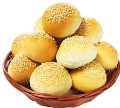
Pão de Hambúrguer Mini 40g / 7kg Fermentação Alta (4h a 6h)