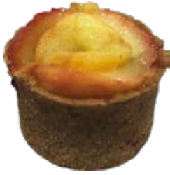
Tortelete Maça Souttlê und.

Sabores: Banana, Gérmem de Trigo e Castanha do Pará Banana, Manga, Nozes, Ameixa e Coco