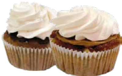
Cupcake Fit und.

Sabores: Banana, Gérmem de Trigo e Castanha do Pará Banana, Manga, Nozes, Ameixa e Coco