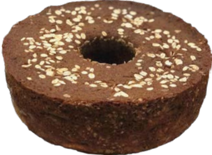
Bolo Fit Banana Integral 500g und.