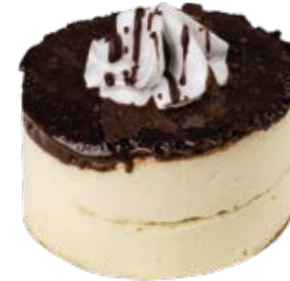
Tortelete Alemã und.