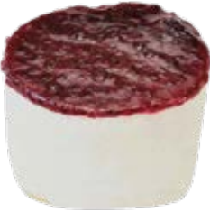
Tortelete Cheesecake e Frutas Vermelhas Zero Açúcar und.