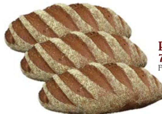
Pão Australiano 70g / 7kg Fermentação Alta (4h a 6h)

*Algumas imagens poderão ser apenas ilustrativas. Todas as medidas descritas poderão sofrer alterações, seja na quantidade por peso, pacote ou outra embalagem.