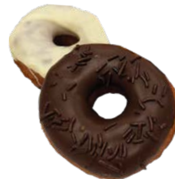
Donuts Americano sem Recheio 0,24kg / 6 unds. Coberturas: Chocolate Preto Chocolate Branco