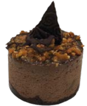
Tortelete Diamante Negro und.