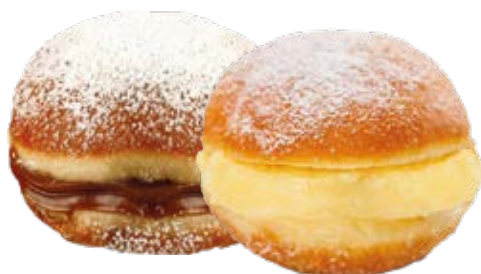
Sonho 0,50kg / 6 unds. Recheios: Creme Doce de Leite Viçosa Doce de Leite Xamego Bom