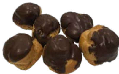
Carolina 0,50kg 20 unds. Recheios: Chocolate Doce de Leite Creme