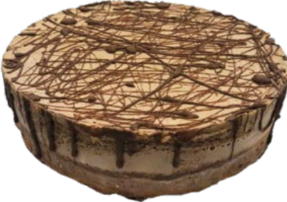
Torta Mousse Chocolate Zero Açúcar und.