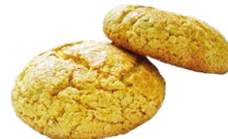
Broa de Milho Cavaca 0,60kg / 6 unds.

*Algumas imagens poderão ser apenas ilustrativas. Todas as medidas descritas poderão sofrer alterações, seja na quantidade por peso, pacote ou outra embalagem.