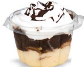
Pavê de Bombom Copo 110ml und.