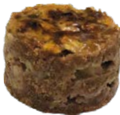
Tortelete Banana Integral und.