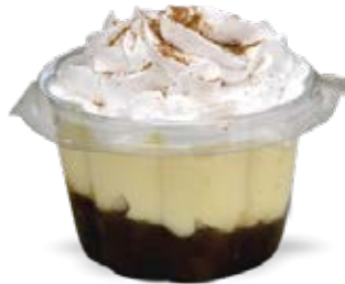
Delícia de Banana Copo 110ml und.