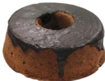
Chocolate 500g ou 1kg