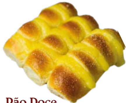
Pão Doce 70g / 7kg Fermentação Alta (4h a 6h)