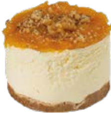
Tortelete Damasco Zero Açúcar und.