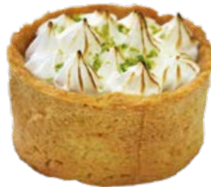
Tortelete Limão und.