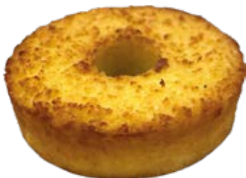
Aipim com Coco 500g ou 1kg