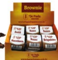
Brownie Caixa Mista 0,78kg / 12 unds. 4 avelãs 4 brigadeiro 4 nozes 4 macadâmia