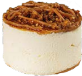
Tortelete Doce de Leite und.