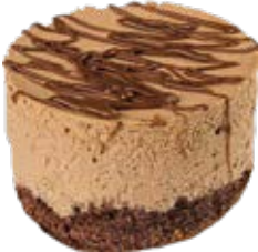
Tortelete Mousse Chocolate Zero Açúcar und.