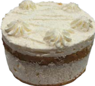
Mini Torta Coco Zero Açúcar und.